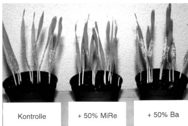
Fig. 2. Kompost MiRe, zugegeben zum Boden, schützt die Gerstenpflanzen gegen den echten Mehltau, auch ohne direkt in Kontakt mit dem Krankheitserreger zu sein. Diese Eigenschaft besitzt der Kompost Ba nicht.

Interessant ist auch die Tatsache, dass hochwertige Komposte nicht nur Pflanzen gegen bodenbürtige Krankheitserreger schützen, sondern auch eine Verminderung der Entwicklung von Blattkrankheiten bewirken können. Mit der Beimischung gewisser Komposte zum Boden konnte der echte Mehltaubefall auf Gerstenpflanzen deutlich vermindert werden. Gewisse Komposte haben somit die Fähigkeit, eine Resistenz in der ganzen Pflanze zu induzieren.